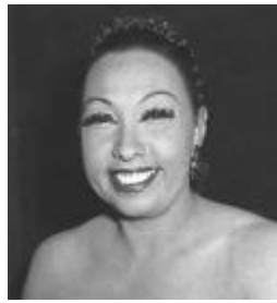
( Joséphine Baker )

BAKER Joséphine (1906-1975) : artiste de music-hall. Militante des Droits de l'Homme. Initiée en 1960 dans la loge « La Nouvelle Jérusalem », Paris.