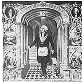
(G. Washington posant la première pierre du Capitole en tenue de franc-maçon)

WASHINGTON, George (1732-1799) : Premier Président des USA, Initié le 4 novembre 1752, à "Fredericksburg Lodge", Virginie, il fut Grand Maître de la Grande Loge Nationale des Etats-Unis.