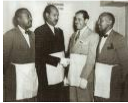
(Cab Calloway, second à gauche)

CALLOWAY Cabell dit Cab (1907-1994) : musicien de jazz, inventeur du « scat ». On lui doit le terme « zazou ». Initié en 1937 à la « Pioneer Lodge » de St Paul ( Minnesota)