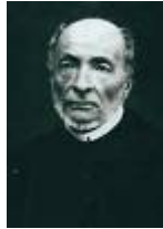
( Victor Schoelcher )

SCHOELCHER, Victor (1804-1893) : Homme . Ayant voyagé aux colonies, il se fit l'apôtre de l'abolition de l'esclavage qu'il réalisa le 27 avril 1848 lorsqu'il fut ministre de la Marine du gouvernement provisoire. Initié Franc-Maçon, avant 1848, à la Loge " Les Amis de la Vérité ", Paris, puis affilié à " La Clémentine Amitié " loge .