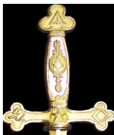
(l'épée de maçon du Frère Lafayette)

LA FAYETTE, Marie Joseph Motier, marquis de (1757-1834) : général et un homme politique français et américain, héros de la Guerre d'Indépendance américaine et personnalité de la Révolution Française. Citoyen d'honneur des États-Unis d'Amérique. Vraisemblablement initié, en 1775, à la loge "La Candeur", Paris puis reçu Franc-Maçon à la loge militaire "Union Américaine", il rejoignit, ensuite, la Loge "Saint Jean d'Écosse du Contrat Social" puis la loge "Les Amis de la Vérité" de Rosay en Brie dont il fut Vénérable.