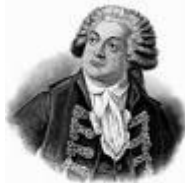
( Mirabeau )

MIRABEAU Honoré Gabriel Riqueti, comte de (1749-1791) : célèbre tribun de la Révolution. Il aurait été initié par la loge de Bastia alors qu'il servait en Corse au régiment de Royal-Italien sous le nom de Pierre Buffière, qui était l'un des titres de sa famille. Il fréquenta, à partir de 1783, la loge « Les Neuf Soeurs » à Paris.