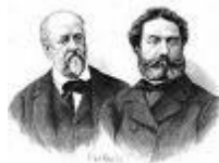
(Erckman et Chatrian)

CHATRIAN, Alexandre (1826-1890) En collaboration avec Erckmann, auteur de romans rustiques se rapportant à l'Alsace. Le plus célèbre est L'Ami Fritz. Initié Franc-Maçon, en 1875, à la loge "Alsace-Lorraine" Paris.