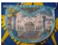
(le tablier d'Helvetius)