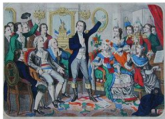
(Rouget de Lisle dans le salon du Frère Dietrich, maire de Strasbourg

ROUGET DE L'ISLE, Claude Joseph (1760-1836) : Officier français, poète et auteur dramatique, en 1792, il créa le « Chant de guerre pour l'armée du Rhin », rebaptisé « La Marseillaise. » Franc-Maçon de la Loge "Les Frères Discrets", à Charleville.