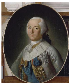
(Philippe Égalité portant les attributs de Grand Maître)

ORLEANS, Louis Philippe Joseph, duc d', (1747-1793) : Connu sous le nom de Philippe Égalité, prince de sang, duc de Chartres en 1752 puis duc d'Orléans en 1785, il mourut sur l'échafaud. Franc-Maçon, il fut Grand Maître de la Grande Loge de France qui devint Grand Orient de France.