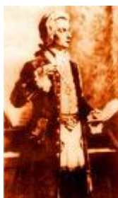
(Mozart en tablier de maçon)

MOZART, Wolfgang Amadeus. (1756-1791) : Compositeur autrichien. Auteur de nombreuses musiques maçonniques et d'un opéra initiatique, « la Flûte Enchantée ». Initié en 1784, par la loge "La Bienfaisance" à Vienne.